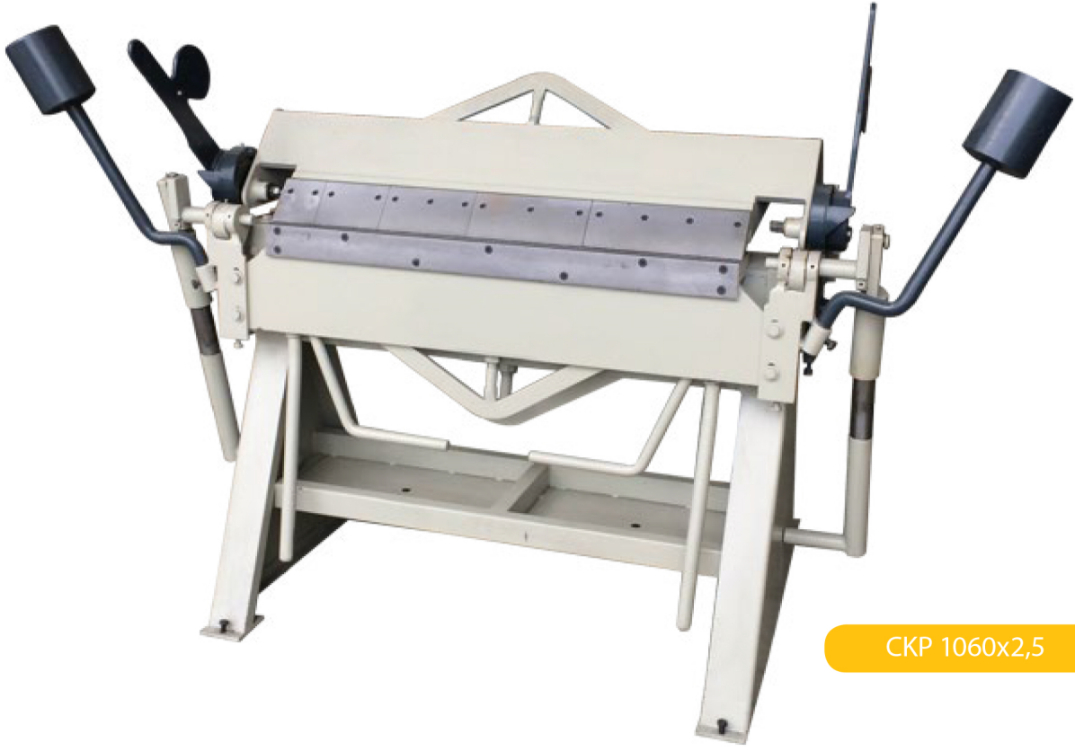
Üst Parçalı Bıçak Ölçüleri / Top Box-Pan Segmented Blades